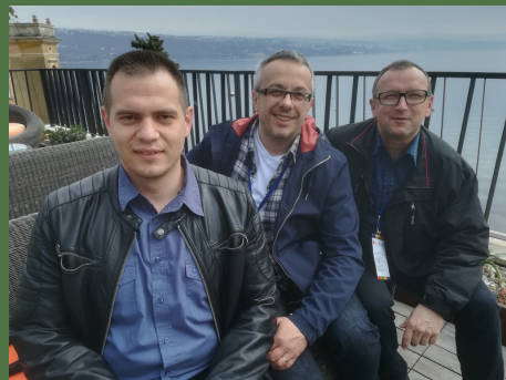
DANI STRUKOVNIH NASTAVNIKA

Da bismo održavali visoku razinu kvalitete nastavnog procesa, naša škola uz potporu ravnatelja veliku pozornost pridaje edukaciji i napredovanju naših nastavnika. Da ova važna stavka ne bi ostala na individualnoj razini samih nastavnika od 2020. godine uveli smo i program organizirane i kolektivne potpore nastavnima za napredovanje u zvanju. Trenutno u školi imamo 3 nastavnika savjetnika i 13 mentora i to iz svih obrazovnih područja te stručnih službi.