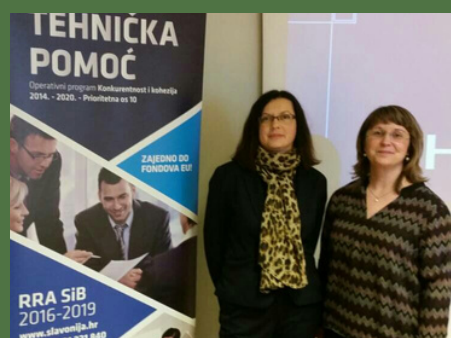
EU EDUKACIJE EDUKACIJE OBŽ

Od prošle školske godine svi učenici gimnazijskog programa imaju nastavu po novim kurikulumima Škole za život, a četverogodišnja strukovna zanimanja nove kurikule imaju iz općeobrazovnih predmeta. Da bi to uspješno mogli provoditi, svi se naši nastavnici redovito usavršavaju u virtualnim učionicama za pojedine predmete kao i na županijskim i međžupanijskim aktivima.